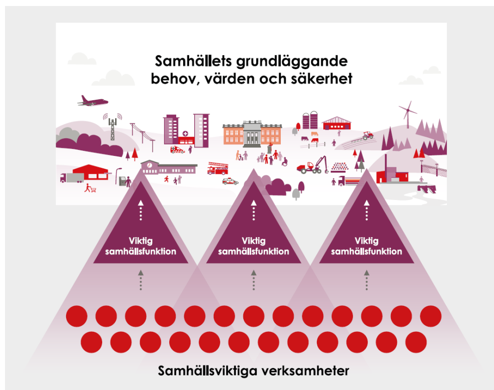
Figur 1. Bild som visar på förhållande mellan samhällsviktig verksamhet och viktig samhällsfunktion.

Kommunen ska analysera vilka extraordinära händelser i fredstid som kan inträffa, identifiera samhällsviktiga verksamheter och beroenden, analysera risker och sårbarheter samt identifiera behov av åtgärder för att därigenom begränsa oönskade effekter på samhällsviktiga verksamheter. Med samhällsviktig verksamhet avses verksamhet, tjänst eller infrastruktur som upprätthåller eller säkerställer samhällsfunktioner som är nödvändiga för samhällets grundläggande behov, värden eller säkerhet.