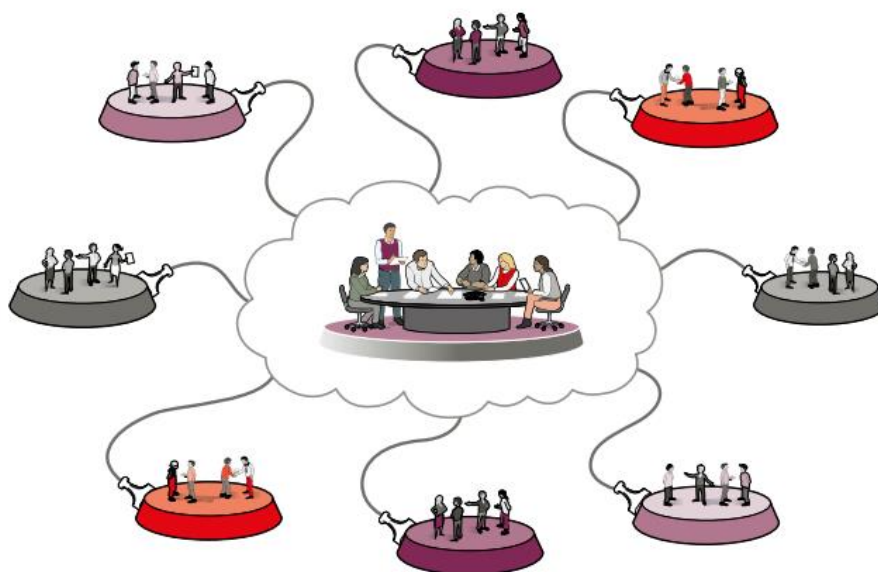
Figur 3. Det lokala geografiska områdesansvaret under en samhällsstörning.

Kommunen ska under en extraordinär händelse verka för samordning mellan olika aktörer inom sitt geografiska område. Med olika aktörer menas såväl offentliga som privata aktörer samt aktörer inom det civila samhället vars insatser kan komma att omfattas av aktörsgemensamma överenskommelser om inriktning och samordning i den aktuella händelsen.