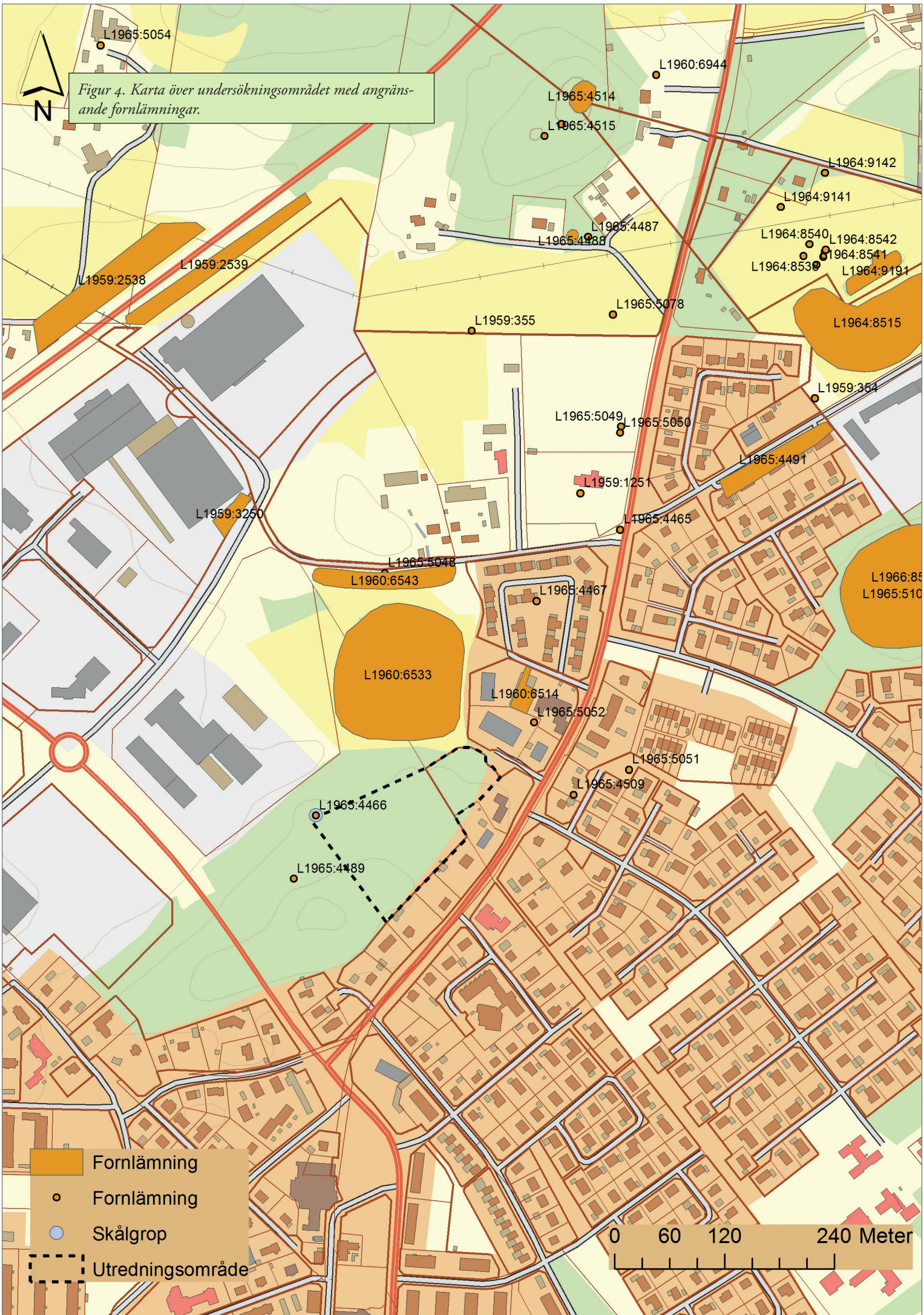
Figur 4. Karta över undersökningsområdet med angränsande fornlämningar.