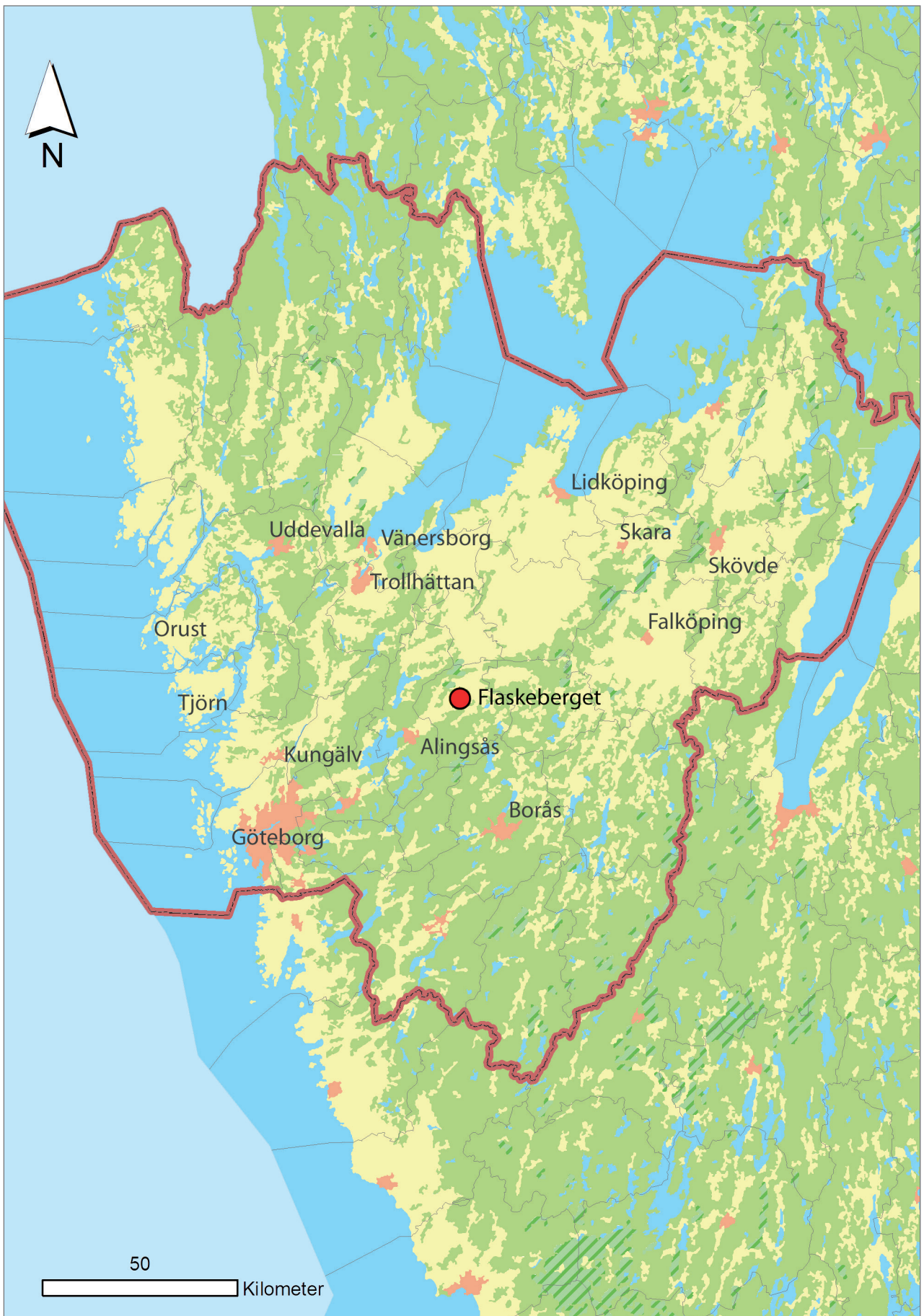
Figur 1. Karta över Västra Götalands län med utredningsområdet markerat.