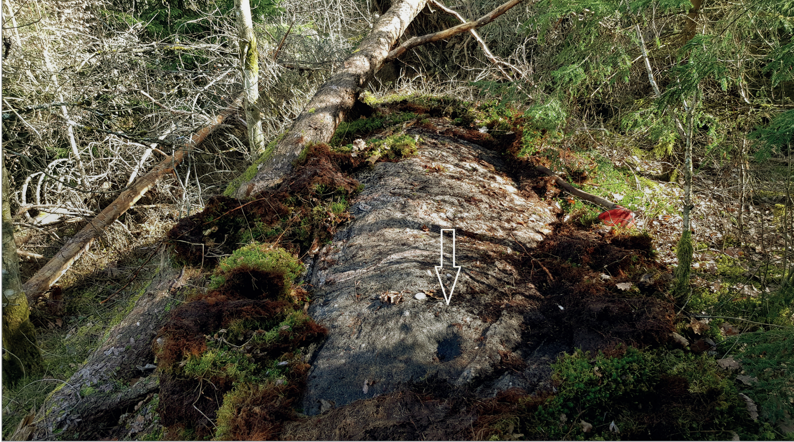
Figur 6. Hällristningslokalen L1965:4466 med skålgropen synlig, markerad med pil.

närheten av skålgropslokalen anser Västarvet kulturmiljö att ytterligare arkeologiska insatser i form av förundersökning är nödvändiga. Skålgropslokalen är tydlig och av intresse för allmänheten. Förslagsvis skulle ett grönområde kunna placeras i anslutning till fornlämningen.