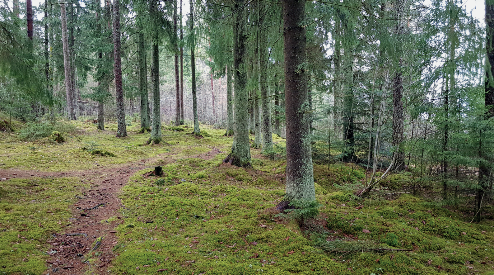
Figur 3. Bild från undersökningsområdet.