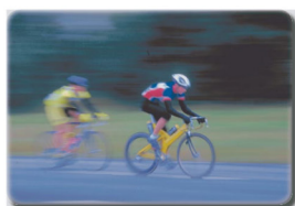
Potential Vårgårda 2006 - 2015